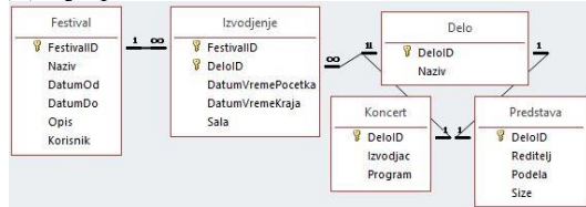
Слика 1. Релациони модел

Потребно је направити клијент-сервер програм који комуницирају преко сокета.