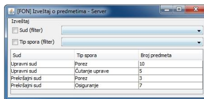
Слика 3. Кориснички интерфејс серверског програма