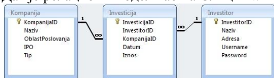
Слика 1. Релациони модел

Потребно је направити клијент-сервер програм који комуницирају преко сокета. Клијент програм је реализован као апликација са графичким корисничким интерфејсом ( обавезно ). Сервер програм је реализован као конзолна апликација ( обавезно ).