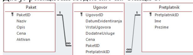
Слика 1. Релациони модел

Потребно је направити клијент-сервер програм који комуницирају преко сокета.