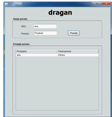
Слика 3. Екранска форма клијента 2